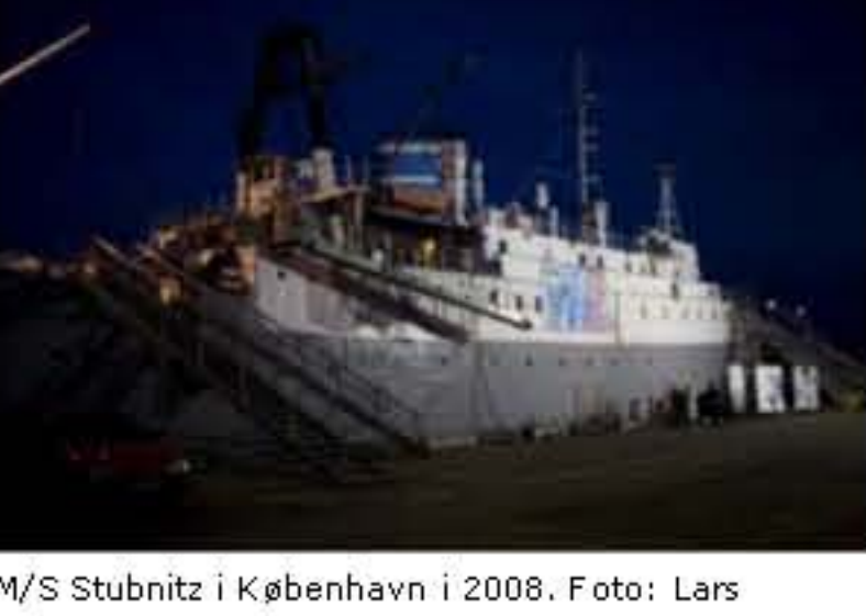
M/S Stubnitz i København i 2008. Se stort billede