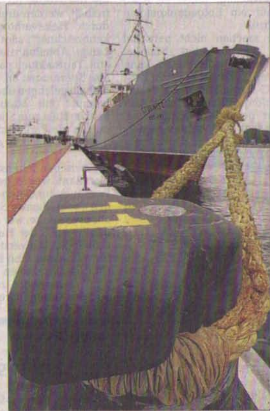
Für einen zweitägigen Kurzaufenthalt hatte die „Stubnitz“ am Passagierkai in Warnemünde festgemacht.